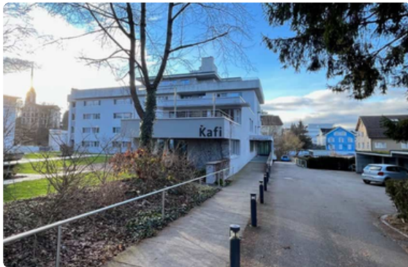
Zentrum Marienfried, Uzwil