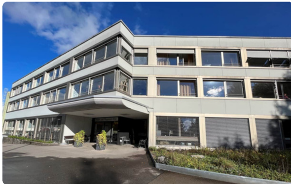
Zentrum Wier, Ebnet-Kappel