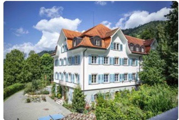
Zentrum Auboden, Brunnadern