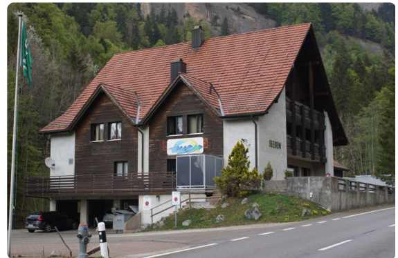
Zentrum Seeben, Nesslau